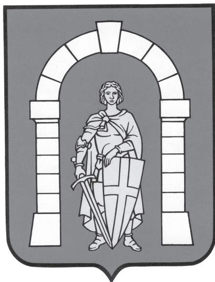
GRB OPĆINE PIROVAC