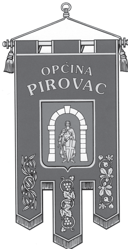
POČASNA ZASTAVA OPĆINE PIROVAC