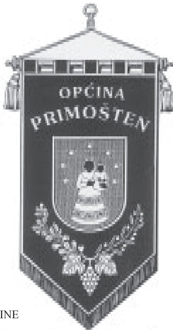
POČASNA ZASTAVA "GONFALON" OPĆINE PRIMOŠTEN