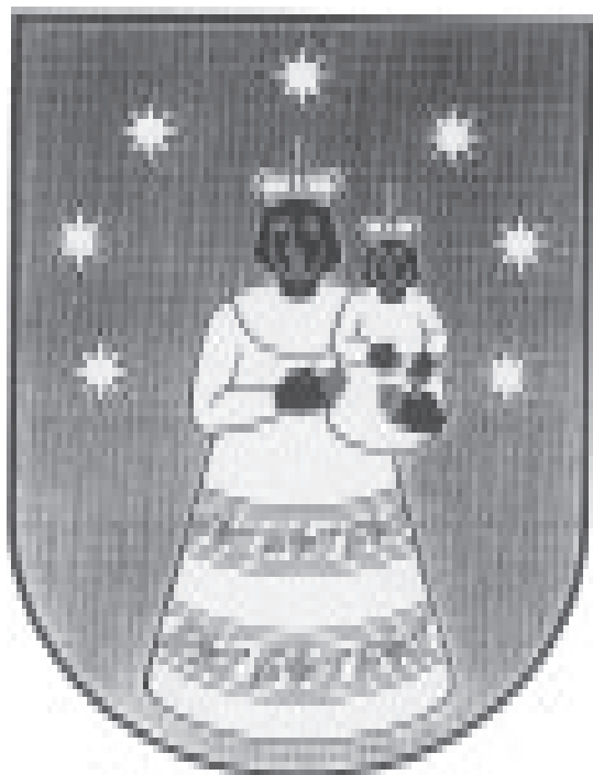
LIKOVNO RJEŠENJE GRBA OPĆINE PRIMOŠTEN